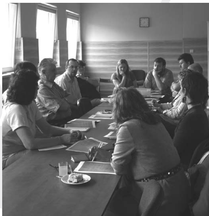
Spotkanie jednej z grup roboczych w siedzibie „Być Razem”