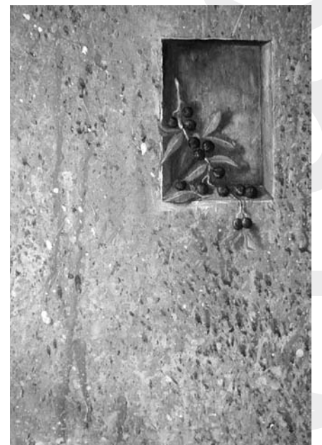
Jedna z prac artysty