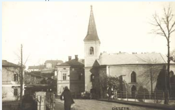
Widokówka z okresu międzywojennego, z archiwum Muzeum Śląska Cieszyńskiego

Zapraszamy Czytelników do współredagowania tej strony. Prosimy o nadsyłanie ciekawostek związanych z Cieszynem (np. anegdot, przepisów kulinarnych, zdjęć, dokumentów, wzorów rękodziela artystycznego itp.), które mogłyby zainteresować innych i wzbogacić wiedzę o naszym mieście. Gwarantujemy zwrot wszystkich otrzymanych materiałów. Wiadomości Ratuszowe, Biuro Promocji i Informacji, Rynek 1, 43-400 Cieszyn, wr@um.cieszyn.pl