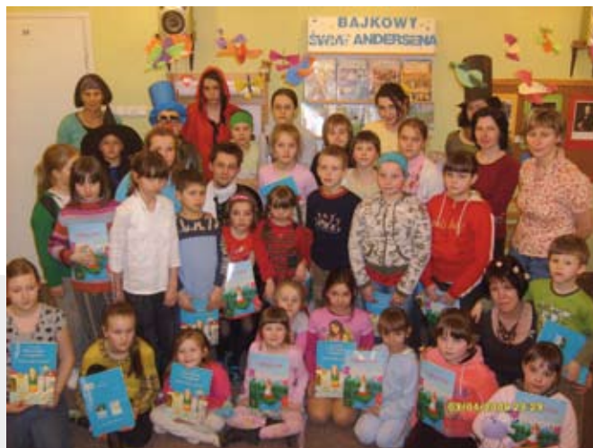
Uczestnicy Nocy z Andersenem