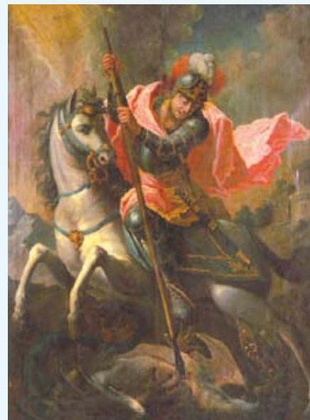
Św. Jerzy, obraz z przytułku, 2 poł. XVIII w., obecnie w Muzeum