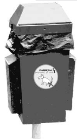
Burmistrz Miasta Cieszyna