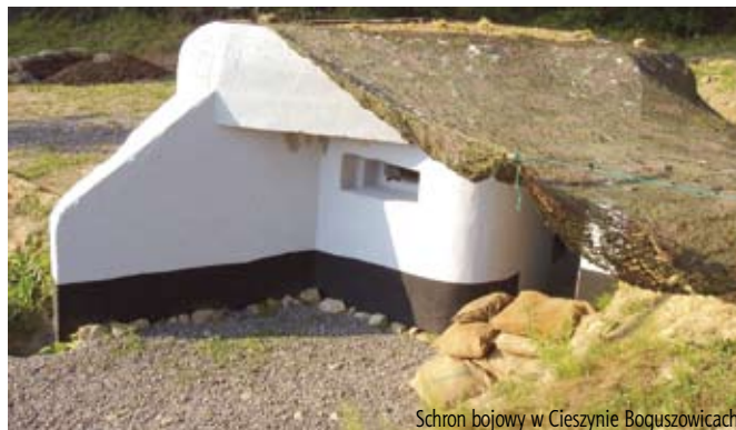
Schron bojowy w Cieszynie Boguszowicach

26 kwietnia (niedziela) w godz. 10.00-17.00 Sekcja Miłośników Militariów zaprasza na dzień otwarty przy polskim schronie bojowym w Cieszynie-Boguszowicach. Na miejscu wystawa militariów oraz wyposażenia schronu, a także możliwość przejażdżki na koniu w wojskowej kulbace.