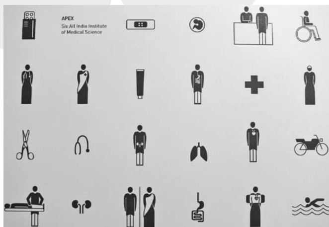
Kognito "System informacji dla kompleksów szpitali w Indiach"