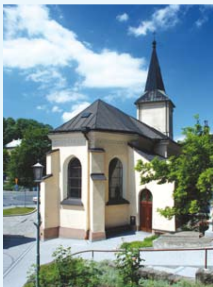
Kościół od strony plebanii