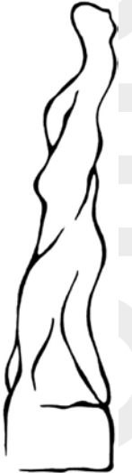
Statuetka Ligi Talentów

Bliższe informacje: Cieszyński Ośrodek Kultury „Dom Narodowy”, Rynek 12, Cieszyn, tel. 0 33 851 25 20, kultura@domnarodowy.pl