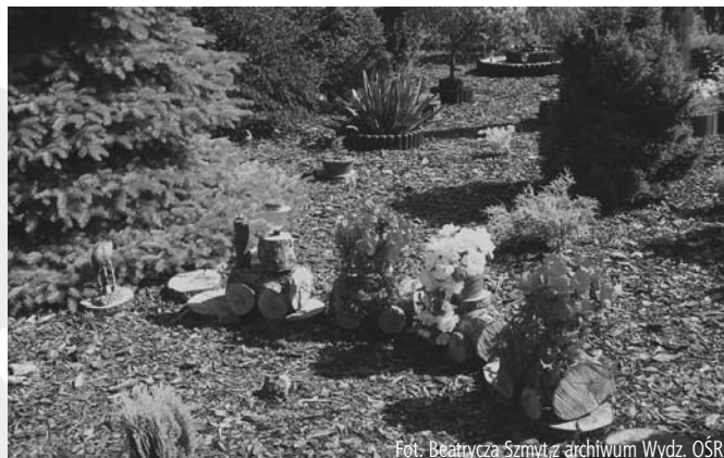
Fot. Beatrix Szmítz archiwum Wydz. OŚR

Termin przyjmowania zgłoszeń upływa 30 kwietnia 2009 r. Zachęcamy Państwa gorąco do udziału w konkursie.